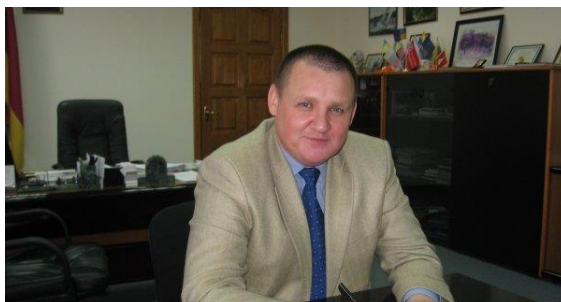
МЕР МІСТА ФОМІЧЕВ Ю. К.