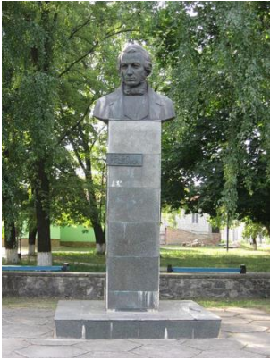
Пам'ятник Євгену Гребінці в місті Гребінці