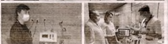
■ Медицина: Новий генеральний директор лікарні. Відкриття відділень медико-соціальної допомоги та для лікування хворих на Covid-19. Закупівля нового медичного обладнання.