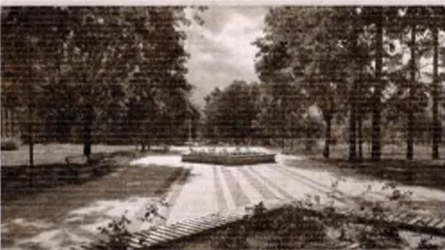
■ Завершено реконструкцію центральної алеї міського парку