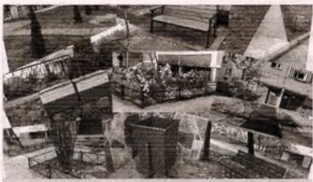
■ Реалізація програми «Благоустрій мого двору»