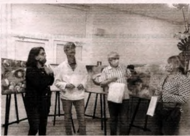
■ Славутич вдруге став столицею сюрреалізму. Арт-резиденція «Семантичний Сюрреалізм Славутича»