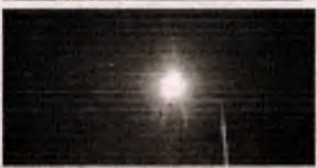
■ Енергосервісний договір Славутича – перший в Україні. Замінено більше 400 світильників магістрального освітлення.