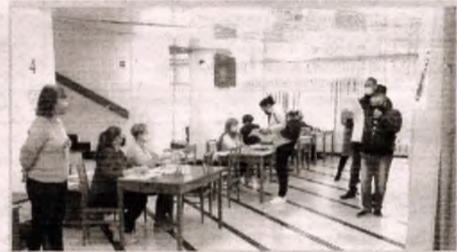
■ Місцеві вибори у Славутичі