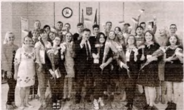
■ Обрання депутатів Молодіжної ради «Майбутнє Славутича»