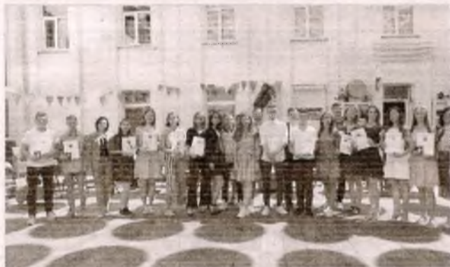
■ Нагородження обдарованої молоді