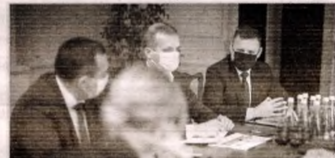
■ Визначені переможці Бюджету участі ■ Славутич став пілотним проектом «Без бар'єрів»