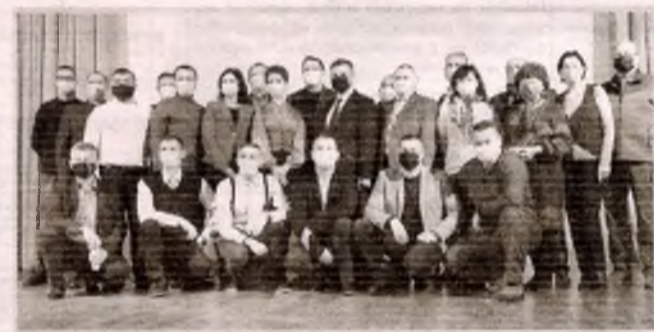
■ 27 листопада 2020 – перша установча сесія Славутицької міської ради VIII скликання ■ Відкриття новорічної ялинки онлайн