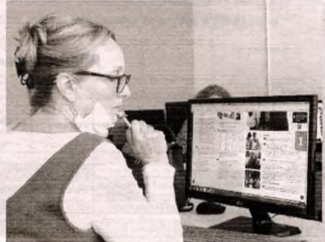
■ Відкриття університету III віку ■ Славутич – переможець конкурсу «Кращі практики місцевого самоврядування – 2020» («Створення муніципального енергокооперативу у Славутичі для будівництва сонячної електростанції шляхом спільнокошту місцевих мешканців»).