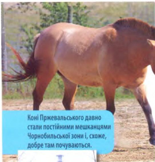
Коні Пржевальського давно стали постійними мешканцями Чорнобильської зони і, схоже, добре там почуваються.

Миңуло ще чимало років. З'явилося багато схожих і навіть вищих за «рангом» документів. Але оживити їх поки що нікому не вдається. Кажуть, що одні зумисно перебільшують наслідки катастрофи, щоб одержати додаткові асигнування для власних бізнес-проектів. Інші пропонують негайно змусити зону заробляти гроші на своє ж утримання – розгорнути, наприклад, переробку деревини для виготовлення недешевого брикетного палива або для використання її в паперово-целюлозній промисловості. При цьому останні кивають на сусідню Білорусь: там, на уражених чорнобильською радіацією територіях, за участі США давно вже побудували першу досліду теплостанцію.