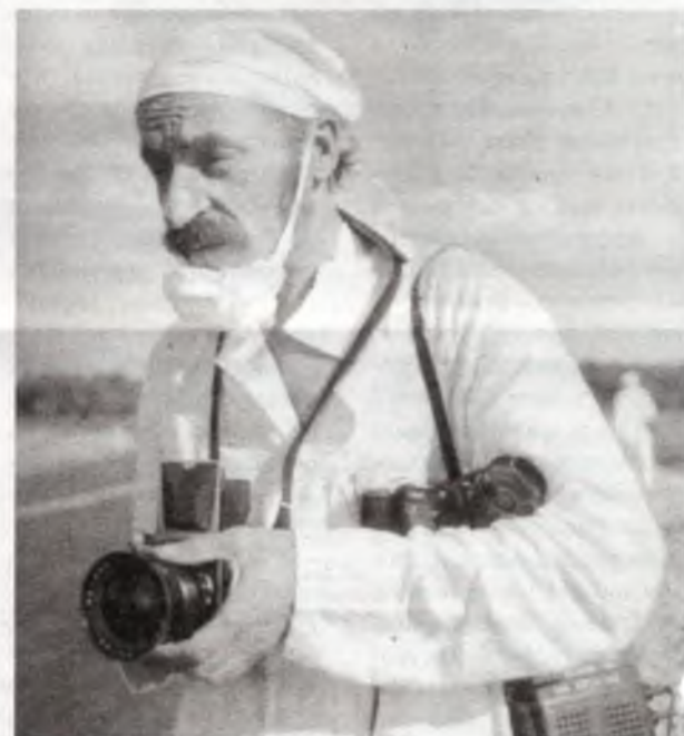
Іван Кузьмич ЛИСЕНКО — фотокор від Бога. Його ім'я як журналіста-жертви Чорнобиля стоїть гідно в одному скорботному ряду з атомниками, пожежниками, військовими — ліквідаторами наслідків Чорнобильської катастрофи. Його вічна пам'ять — фотодокументи.