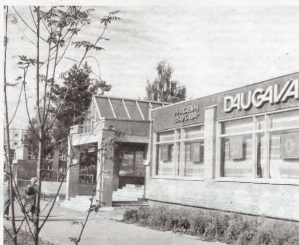
Один із неповторних архітектурних секторів Славутича