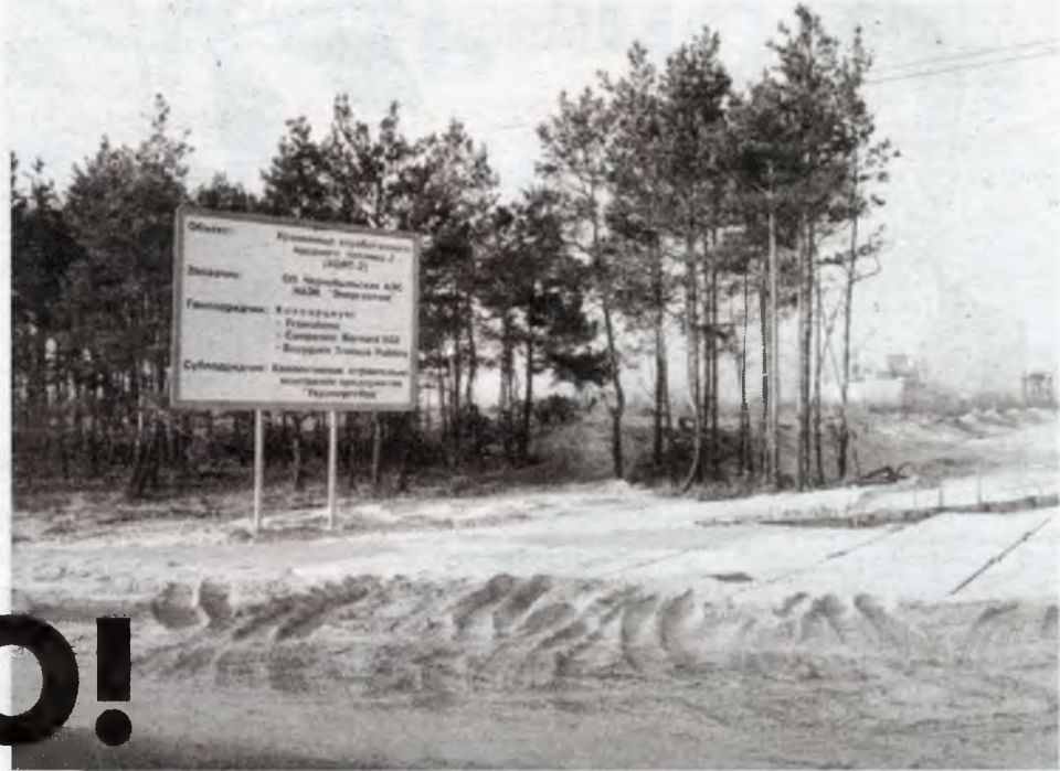
З історії об'єктів ЧАЕС. Так починалося будівництво СВЯП-2

Додаток Ігоря Грамоткіна: Це питання торка-