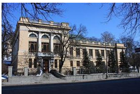
Національна бібліотека України імені Ярослава Мудрого