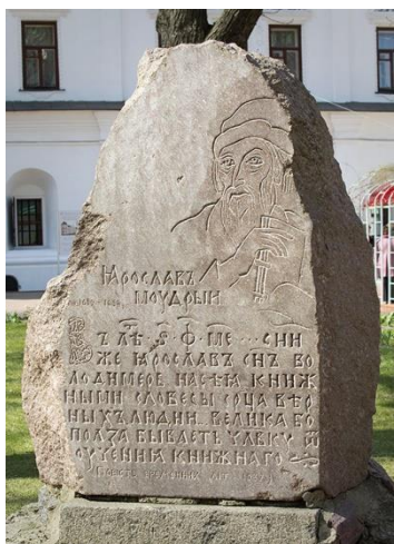
Камінь в пам'ять відкриття бібліотеки Ярослава Мудрого