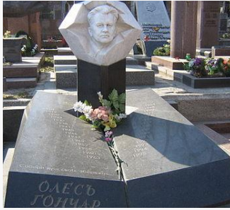
Пам'ятник Олесю Гончару на Байковому кладовищі

Помер письменник 14 липня 1995 р., похований на Байковому кладовищі у Києві.