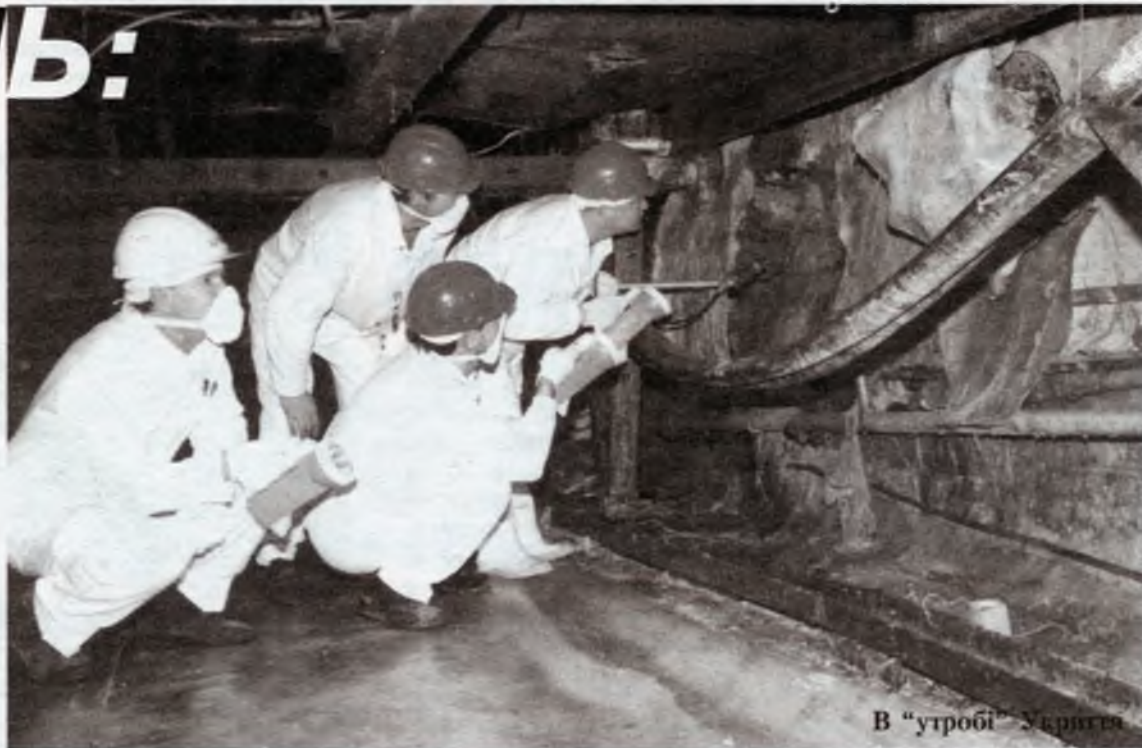
В "утробі" Укриття

Міжнародного Плану переконливого прориву до практичних робіт у "саркофазі" так і не відбулося. Зате майже всі постчорнобильські роки жваво йде напереве й адміністративне освоєння коштів: переписуються старі документи досліджень українських і радянських (російських) вчених, утримуються у Славутичі десятки зарубіжних консультантів з "кращим світовим досвідом", влаштовуються серйозні конференції і презентації, накопичуються тонни нових проєктів, рішень, процедур, бюрократичних звітів тощо. Здебільшого на ці цілі за досить приблизними оцінками витрачено більше 250 млн. доларів (точні дані не оприлюднюються). Далеко не всім хочеться це визнати, але План SIP з огляду на хронічне відставання і непродуктивне освоєння коштів, був приречений на провал чи не з самого початку його реалізації. Варто лише нагадати, що за первісним графіком SIP детальний проєкт нового Укриття мав бути готовий десь у 2001 році, будівництво його закінчиться у 2004-му, а роботи з демонтажу покрівлі та інших нестабільних конструкцій - у 2005 році. Пояснення причин такого стану лише унікальністю проєкту, необхідністю пошуків і прийняття нових, нестандартних рішень шляхом проб і помилок, уже давно не переконує. Аналітики згадують, що на початку реалізації Плану SIP, а це десь 1997-98 р.р., в Україні була та-