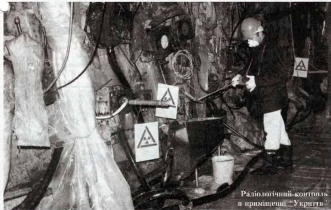
Радіологічний контроль в приміщенні "Укриття"

потрібна нова захисна оболонка, то така, щоб давала можливість відносно швидко вилучити злишки палива. А якщо це реально, то чи не краще законсервувати об'єкт, зокрема, шляхом часткового бетонування деяких його приміщень і ненадійних конструкцій? Це буде набагато дешевше, безпечніше і відповідатиме нинішній стратегії нашої держави.