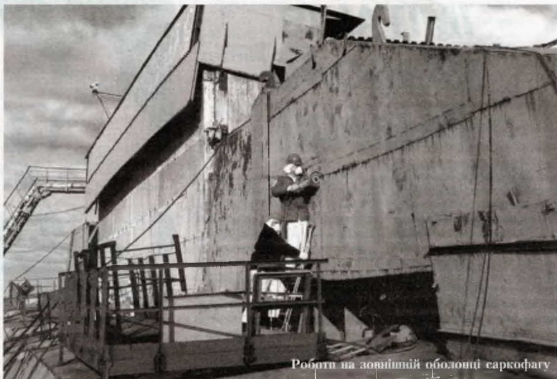
Роботи на зовнішній оболонці саркофагу

Проблема вилучення радіоактивних матеріалів із "нутра саркофага" була однією з основних