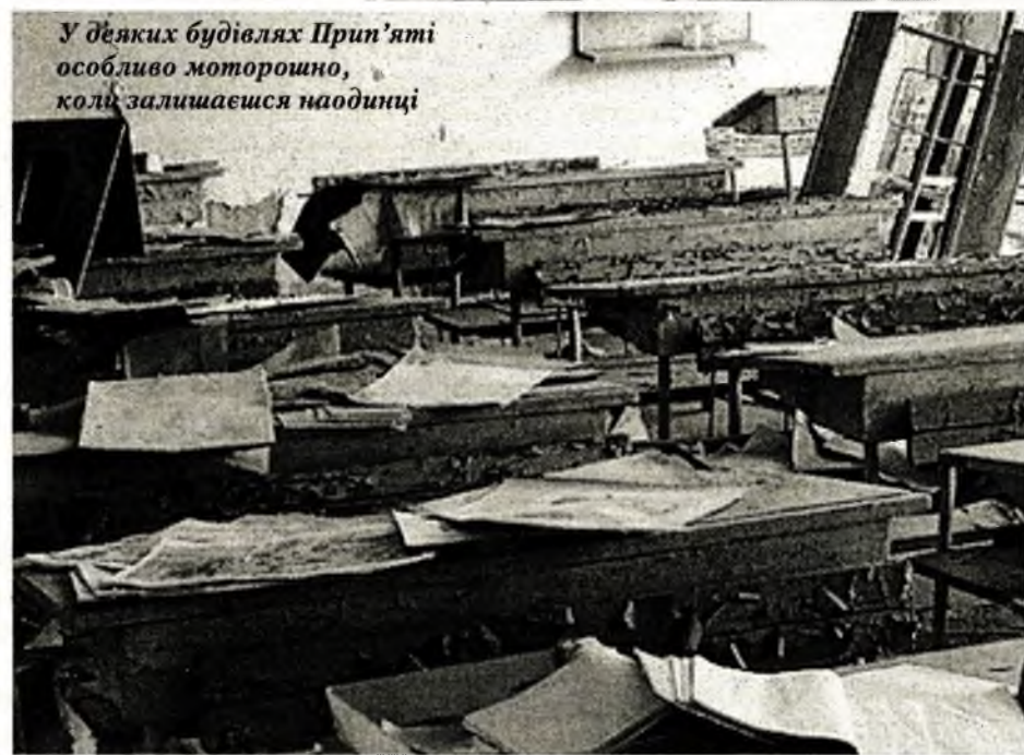
У деяких будівлях Прип'яті особливо моторошно, коли залишаєшся наодинці

домашню птицю та худобу, збирають у тамтешніх лісах гриби, ягоди, а в місцевих водоймах – ловлять рибу".