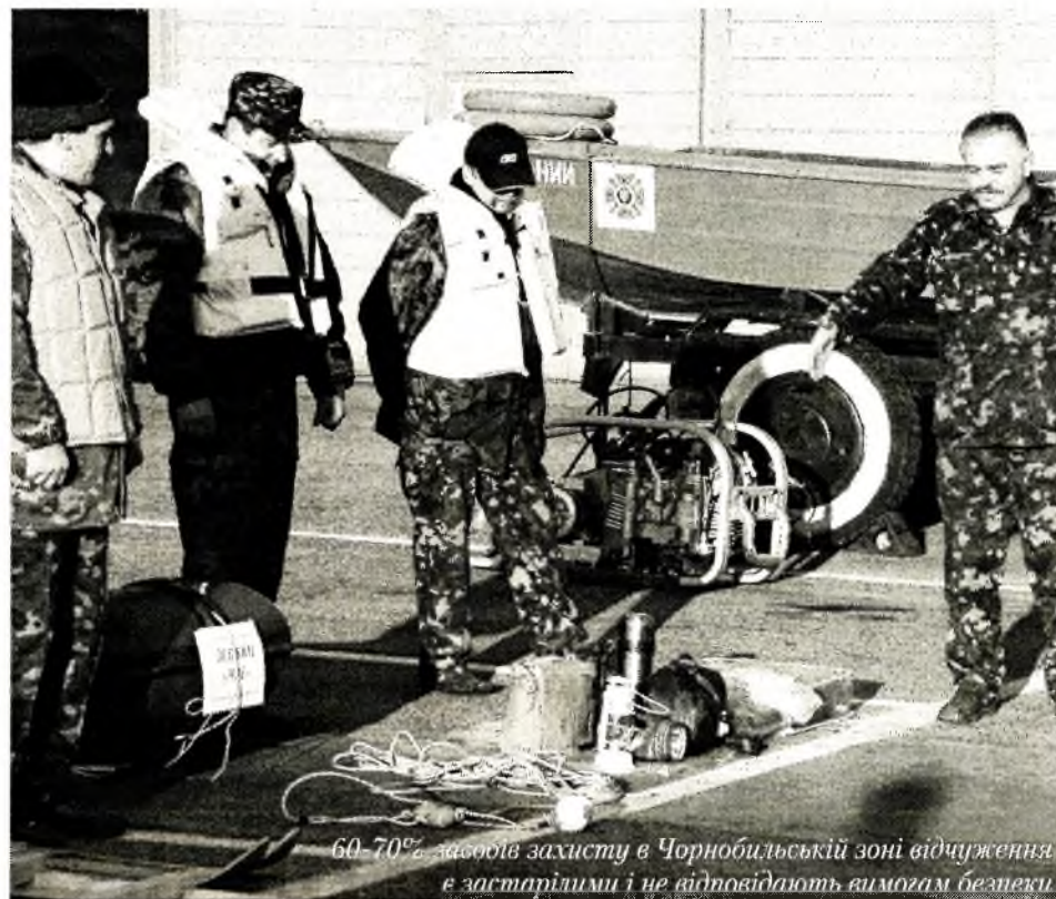
60-70% засобів захисту в Чорнобильській зоні відчуження є застарілими і не відповідають вимогам безпеки.