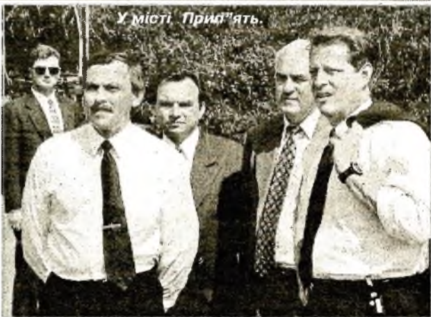
У місті Прип'ять.