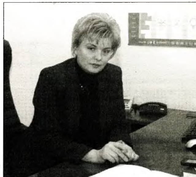
Линник Світлана Олексіївна, директор Державного департаменту у справах захисту населення від наслідків Чорнобильської катастрофи МНС України

Хочу побажати всім міцного здоров'я, щастя, а ще – державної підтримки.