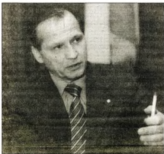
Холоша Володимир Іванович, Голова Державного агентства України з управління Зоною відчуження

Мої сподівання від 2011 року такі ж, як у Президента України – щоб усе задумане щодо чорнобильських програм успішно здійснилося. Що стосується Чорнобильської зони відчуження, то не слід легковажити режимністю її роботи. Відкриті двері до Зони відчуження – це лише алегорія, а безконтрольно туди ніхто не потрапить. З іншого боку, ми зробимо все, аби надати можливість бажаючим ознайомитися з цією територією та розташованими на маршруті об'єктами, забезпечивши при цьому належний рівень безпеки.