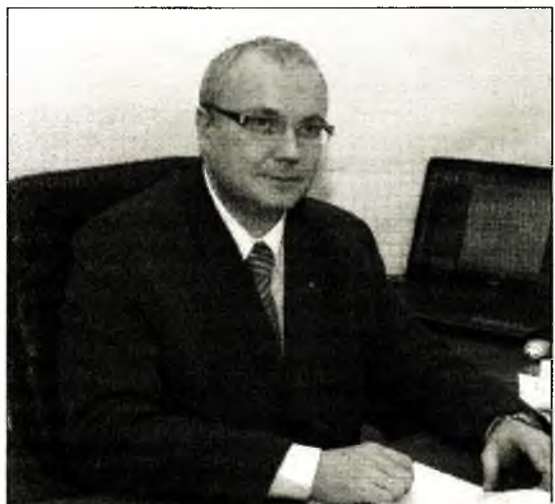
Бобро Дмитро Геннадійович, начальник Державного департаменту – Адміністрації зони відчуження і зони безумовного (обов'язкового) відселення

Щастя всім, здоров'я, родинного замирення, добра й любові!