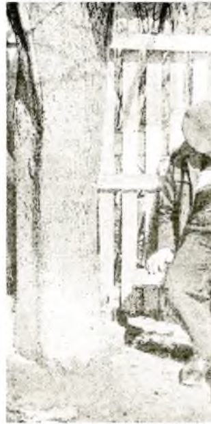
Таких любителів оковитої, як цей чоловік у с. Феневичі, я бачив під час подорожі дуже багато. Жаль, що на них немає сучасного Єгора Кузьмича Лигачова.