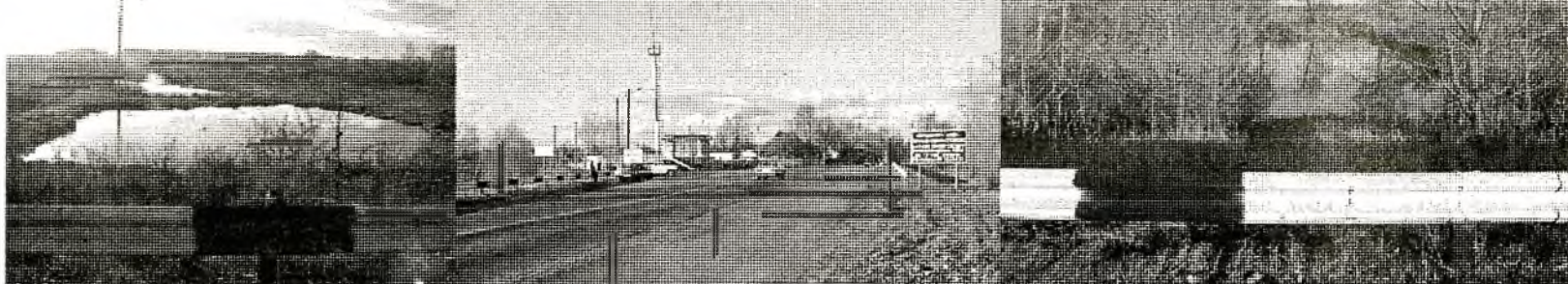
Живою згадкою про старе русло р. Ірпінь є два озера по обидва боки КПП "Демидів". Подумки з'єднавши їх, можна уявити колишню велич і красу річки.