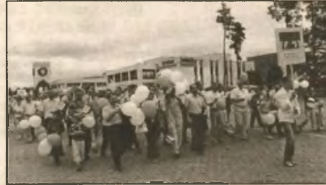
Идут работники объекта "Укрытие"