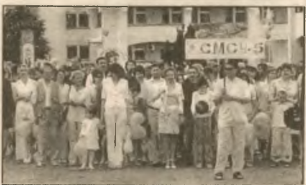
МСЧ-5 всегда на боевом посту