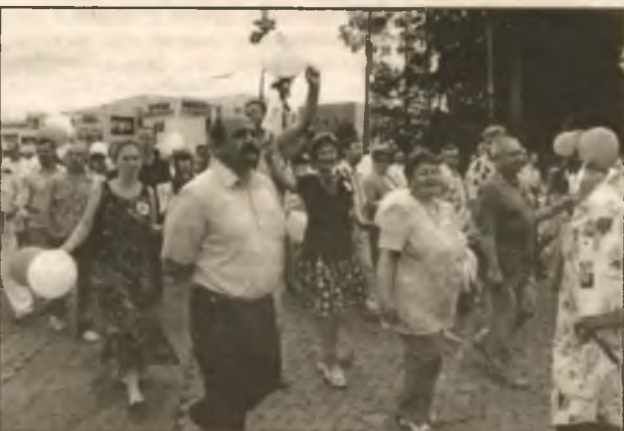
3800 человек трудятся на ЧАЭС. Коллектив с честью справляется с поставленными задачами, приобретает опыт, который необходим не только в Украине, но и во всем мире. 150 работников имеют высокие правительственные награды, 9 — носят звание "Заслуженный энергетик Украины"

В единой дружной колонне славутичской общины прошли организации и трудовые коллективы на праздничной демонстрации, посвященной 20-летию Славутича. По традиции, в первую субботу июня отмечается День города. Это и праздник, и дань уважения строителям из всех республик, а сегодня независимых государств, и подведение итогов творческого развития и побед. В эти дни проходит чествование славутчан, которые добились ощутимых успехов в производственной, финансовой, социальной и творческой сферах.