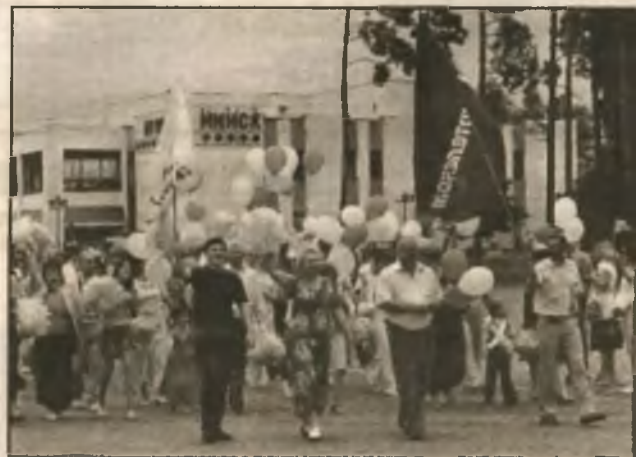
Без почты и "Укртелекома" мы просто как без рук