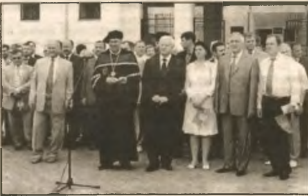
На площади руководство города, депутаты, гости