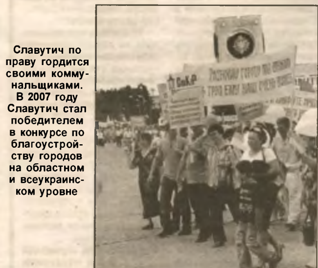
Славутич по праву гордится своими коммунальщиками. В 2007 году Славутич стал победителем в конкурсе по благоустройству городов на областном и всеукраинском уровне