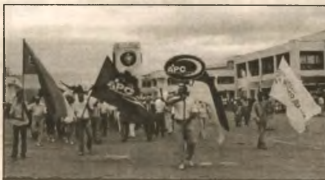
"АРС" — эту аббревиатуру знают не только в Украине, но и за ее пределами. Эта организация три года подряд побеждает в конкурсе "Лучший работодатель года" в Киевской области