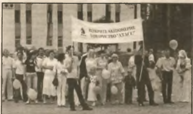
Водителей из фирмы АТАСС знают и в Киеве, и в Борисполе, и даже за границей