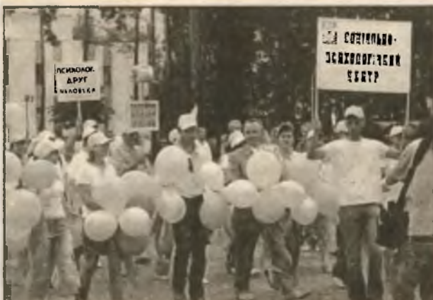
СПЦ знают и взрослые и дети. Тренинги и консультации, лекции и социологические исследования. Профессионалы и просто хорошие люди