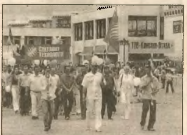
Новые технологии и новые производства

Продолжение праздничного фоторепортажа — в следующем номере.