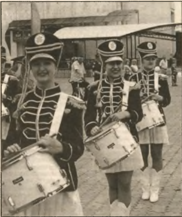
Праздничное шествие открывают оркестр "Геликон" и барабанщицы — студентки Национального университета ГНС Украины (Ирпень)