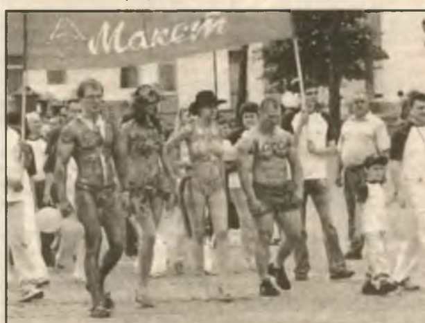
Сеть кабельного телевидения, профессиональный Интернет — все это "Макет"