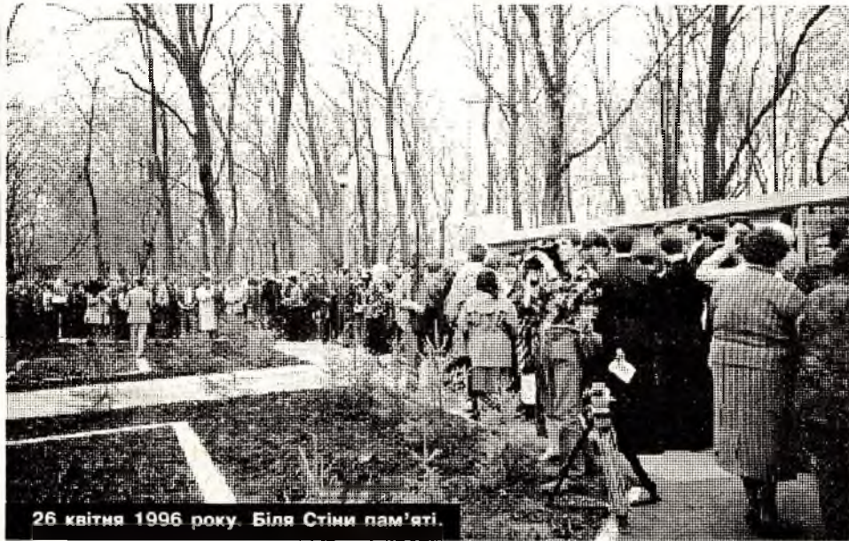
26 квітня 1996 року. Біля Стіни пам'яті.

На душі України не зменшується, ятрить горем чорнобильська рана. За десяти років у небуття пішли десятки тисяч її синів і дочок. Не встиг наш народ змиритися з поняттям, викликаним словосполученням "воєнні сироти", як з'явилось інше - "чорнобильські сироти". Гірко це ймення. Тяжко носити його на собі дітям тих, хто поклав життя на вівтар України, аби врятувати її від атомного лиха. Хто кинувся у нерівний бій з ним у перші хвилини. Хто працював опісля на ЛНА, виконуючи громадянський обов'язок... На всіх їх лягла тяжка печать. Їх не стало. Та навіки збережемо ми, живі, пам'ять про учасників ліквідації наслідків аварії на Чорнобильській АЕС. Вона - у серцях наших і прийдешніх поколінь. Вона - викарбувана на гранітних плитах пам'ятників і стел.