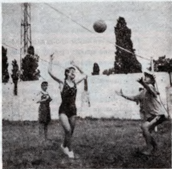
На фото: «коварная» подача, на «тыл» с компьютером.

Давно нет здесь ежедневных, под стук барабанов, утренних и вечерних построений по форме, с традиционными, как раньше, галстуками, с обязательными рапортами и речевками. Нет принудительных мероприятий, недземлющих часовых у ворот и в проломах заборов, нет таких же «неподкупных чекистов» за каждой дверью. Не принято в коллективе выгонять всех на утреннюю физзарядку — за день так намнешь свои кости, что никакая разминка не нужна. Дети здесь просто отдыхают. Потравляют здоровье, набираются сил. Подъем в обычные дни — в восемь утра, в выходные и праздники — на пол-