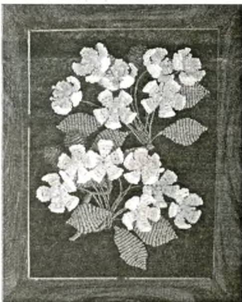
Майже живі квіти

— Звичайний, із наших, славутицьких магазинів. Найкращий, звичайно, чеський, але він і найдо-