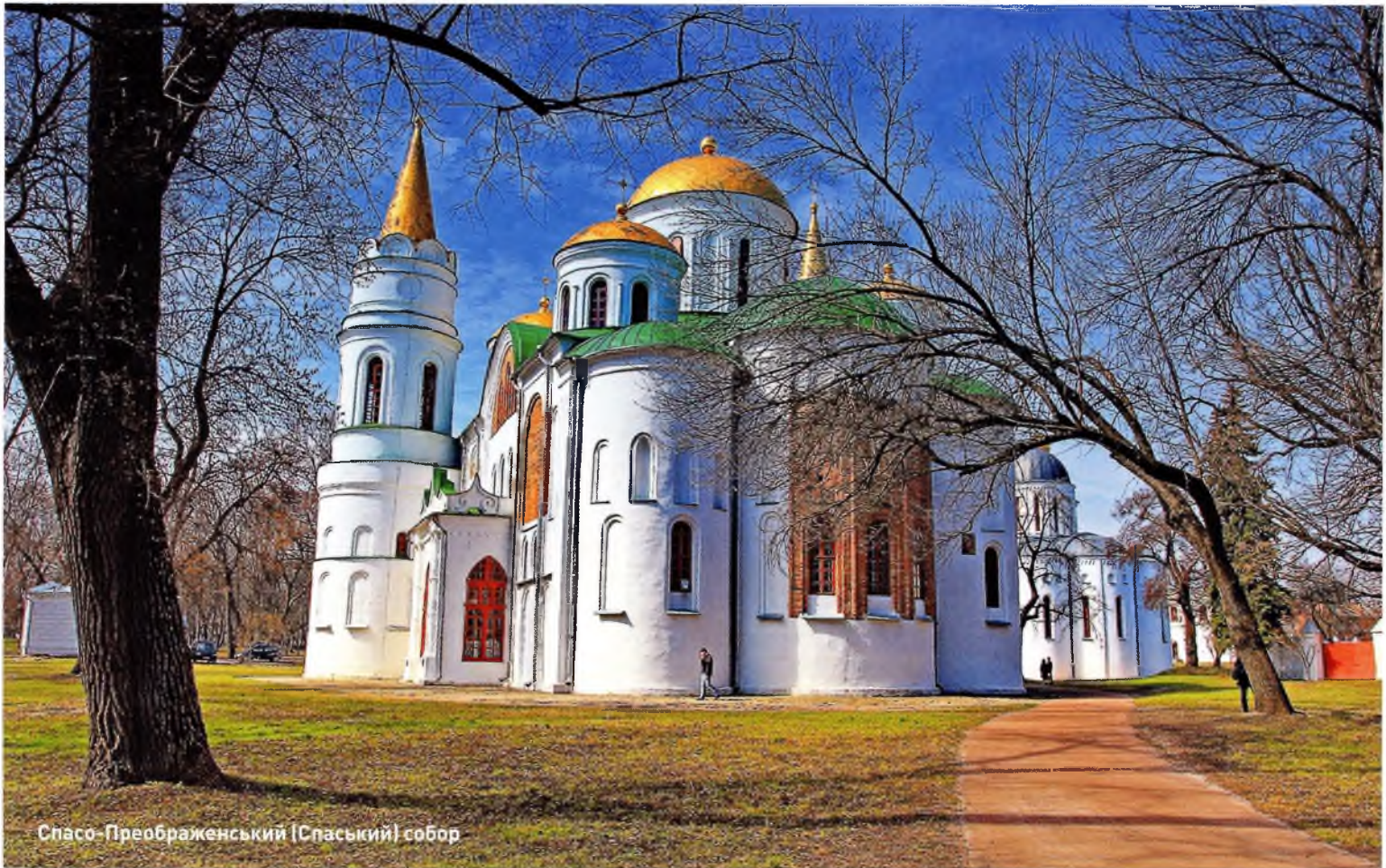
Спасо-Преображенський (Спаський) собор