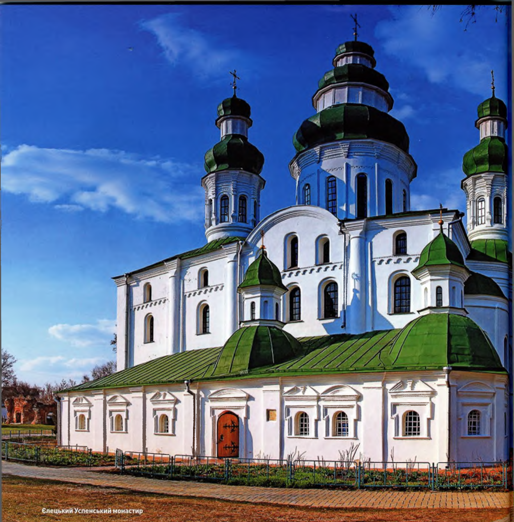
Єлецький Успенський монастир