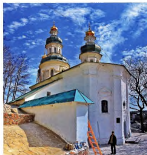
Іллінська церква – православний храм XII-XVIII століть, що входить до ансамблю Троїцько-Іллінського монастиря