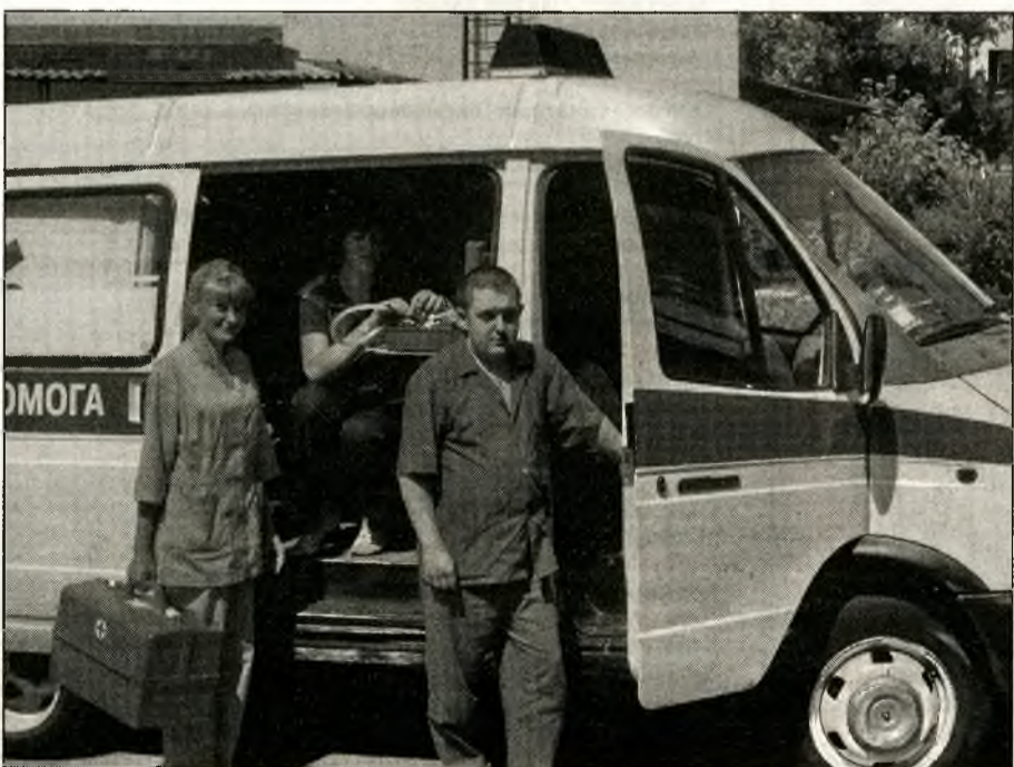
Работники скорой помощи