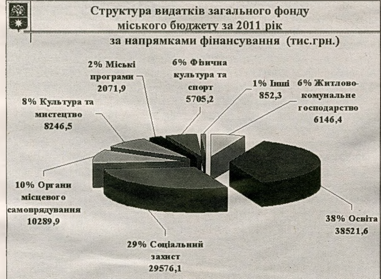
Структура видатків загального фонду міського бюджету за 2011 рік за напрямками фінансування (тис.грн.)