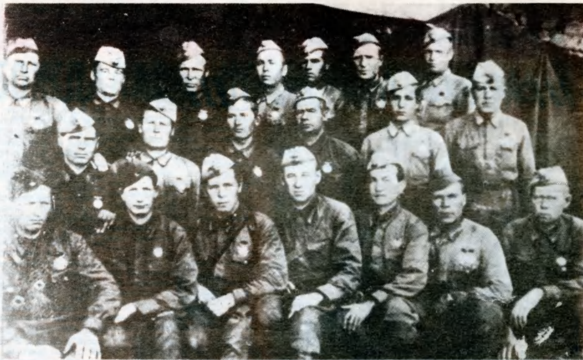
Разведчики 8 стрелковой дивизии. Вручение наград. 1942 год.