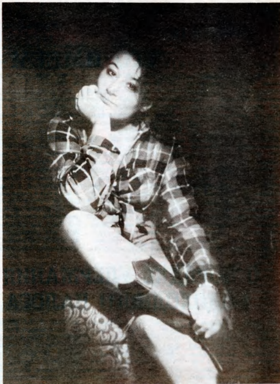
КАК МОЛОДЫ МЫ БЫЛИ...