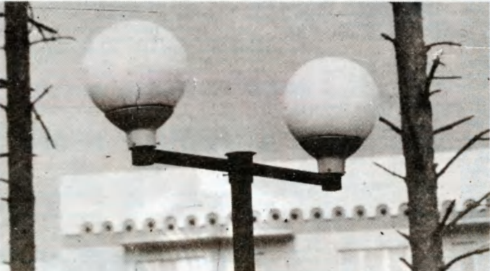
СЛАВУТИЧ БЕЗ ФОНАРЕЙ — ЭТО НЕ СЛАВУТИЧ.