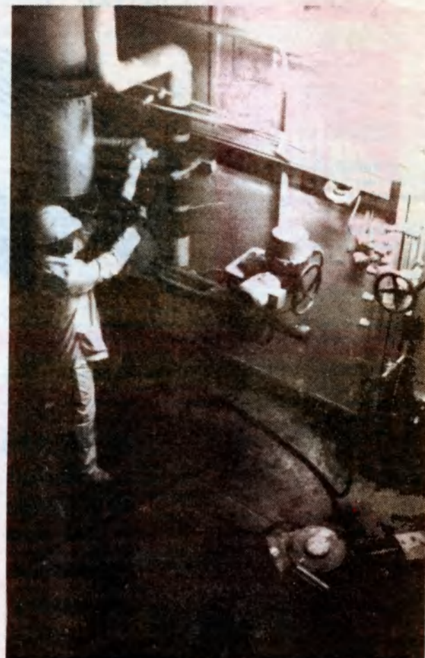
ЩИТ СПЕЦВОДОЧИСТКИ БЛОКА № 3 ЧАЭС

(По материалам пресс-релиза фирмы АЕА Technology)