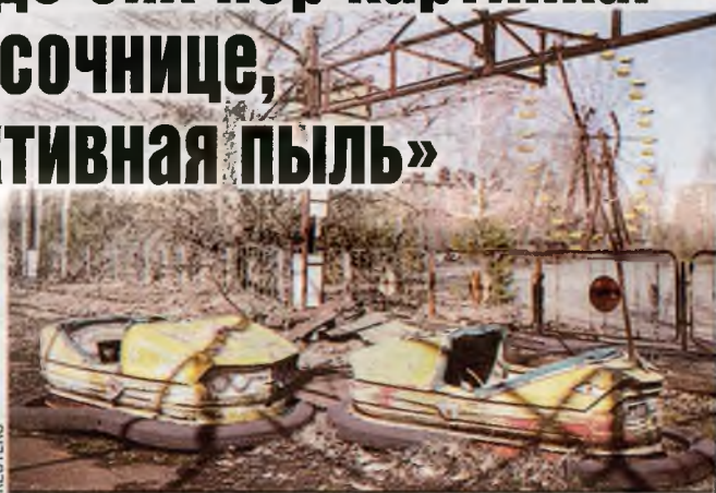
Зона отчуждения с каждым годом выглядит все зловещей.

За помощью в тушении «кипящего» реактора советские специалисты обратились к спецслужбам всего мира, но ответа ни от кого не получили: опыта борьбы с такой катастрофой не имел никто. С того момента на уровне Москвы было принято решение: на документы, касающиеся аварии на Чернобыльской АЭС, ставился гриф «секретно».