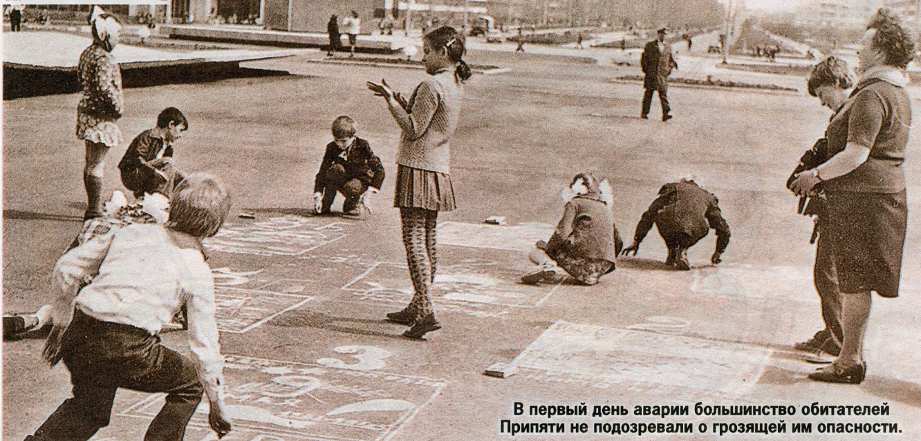
В первый день аварии большинство обитателей Припяти не подозревали о грозящей им опасности.