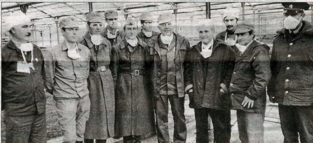
Заступник голови Ради міністрів УРСР Микола Федорович Ніколаєв був одним із головних організаторів ліквідації аварії (п'ятий праворуч, автор матеріалу — другий праворуч). Місто Прип'ять, вересень 1986 р.

Із роками притуплюється гострота пережитої трагедії. Нові покоління вже мало що знають про неї. Тому одна з головних вимог сьогодення — збереження пам'яті й усвідомлення її уроків. Чорнобильська катастрофа показала, наскільки тісним і взаємопов'язаним став світ у ядерну епоху. А це визначає величезну відповідальність держав та урядів за безпеку народів і життя на землі.