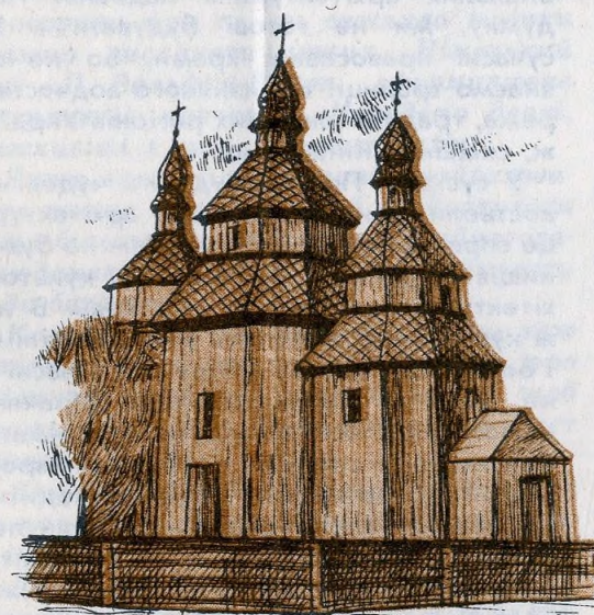
•Церква с.Уляники/1768/ ЗА С.ТАРАНУШЕНКО