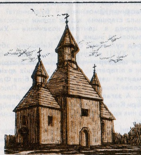
•Церква з с.Дорогинка/1600/

* В рамках дослідження автор умовно визначає Київщину в межах колишньої Київської губернії.