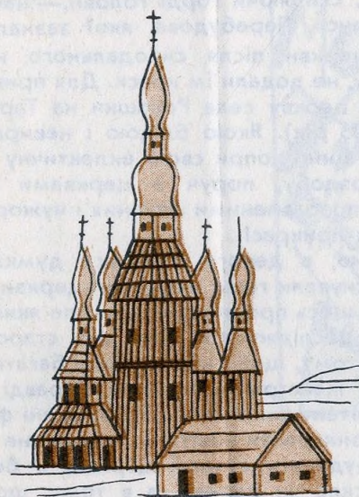
•Церква с.Плісєцьке/1745/ /МАЛ. ДЕЛЯФЛІЗА/