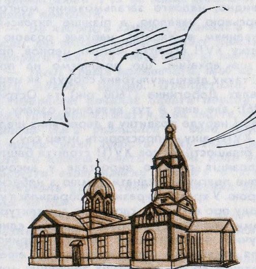
•Церква с.Росишки/1905/ /МАЛЮНОК З ФОТО/