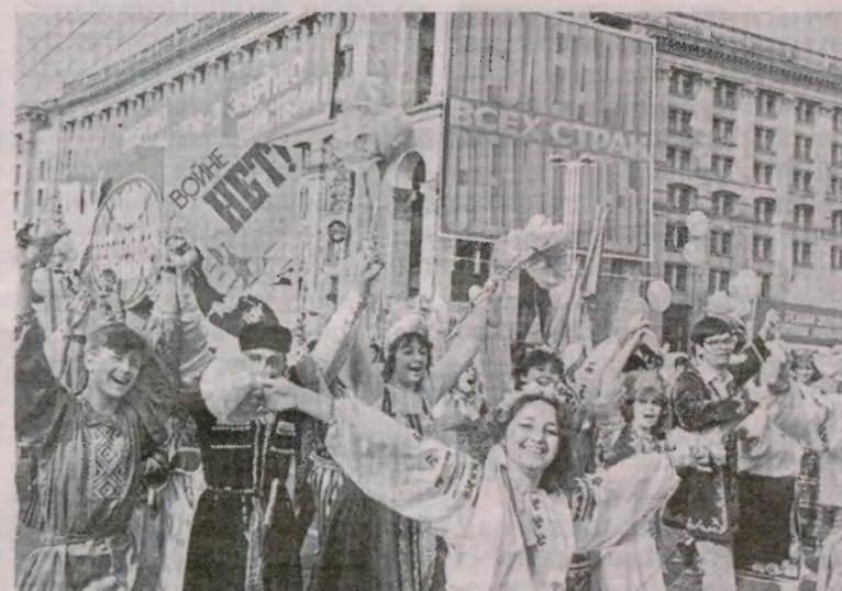
Першотравнева демонстрація в Києві. 1986 рік

Увечері 28 квітня, коли за дві доби шаленого протиборства з наслідками чиеїсь некомпетентності й нехлюйства в нашій країні на кількості героїв стало більше, диктор програми «Время» зачитав сухе повідомлення ТАРС. Техногенний глобальний катаклізм він назвав «нещасним випадком із пошкодженням реактора». Це перша офіційна звістка про «чорнобильський інцидент!» Тоді, коли 1,5 тис. людей, зокрема, дітей, потерпіли від опромінення, верховні керманічі відмовилися від допомоги Всесвітньої організації охорони здоров'я.