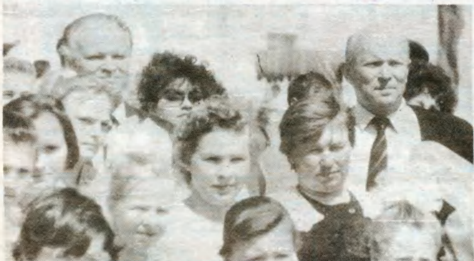
Репортаж вели Борис ИВАЩЕНКО и Николай ЛОЗИН