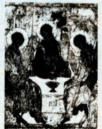
Репродукция. А. Рублев «Живоначальная Троица».