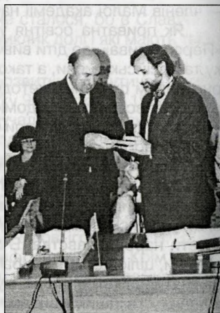
Нарада з питань економічного розвитку м. Славутича за участю посла США в Україні Карлоса Паскуала

— вивчення ставлення населення до місцевого підприємництва і можливих напрямів подальшого розвитку регіону;