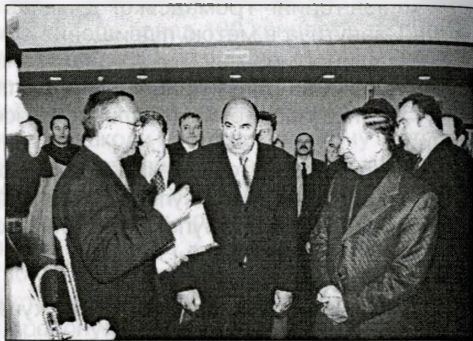
У залі урочистих подій під час перебування Президента України Л. Кучми

Як продовження наукових досліджень впливу техногенних катастроф на різні сфери життя і важливої складової організаційно-економічного механізму соціальної політики планується створення в м. Славутичі Реабілітаційного медичного центру на базі спеціалізованої медико-санітарної частини № 5 із залученням Українського національного центру радіаційної медицини. Створення такого центру дозволить провадити дослідження в сфері радіомедицини і наслідків впливу на стан здоров'я населення, що проживає і працює в забруднених регіонах.