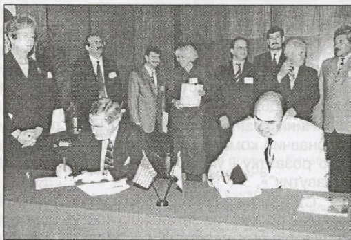
Підписання Угоди про партнерство між Славутичем та Річлендом (штат Вашингтон США)

Місто має надійну організаційно-економічну основу, стартові можливості для майбутнього розвитку. Відпрацьовані різні напрями діяльності, величезний обсяг робіт у зоні ЧАЕС, існують і проблеми, пов'язані з новою технологією виведення блоків з експлуатації, переробки та захоронення радіоактивних відходів.