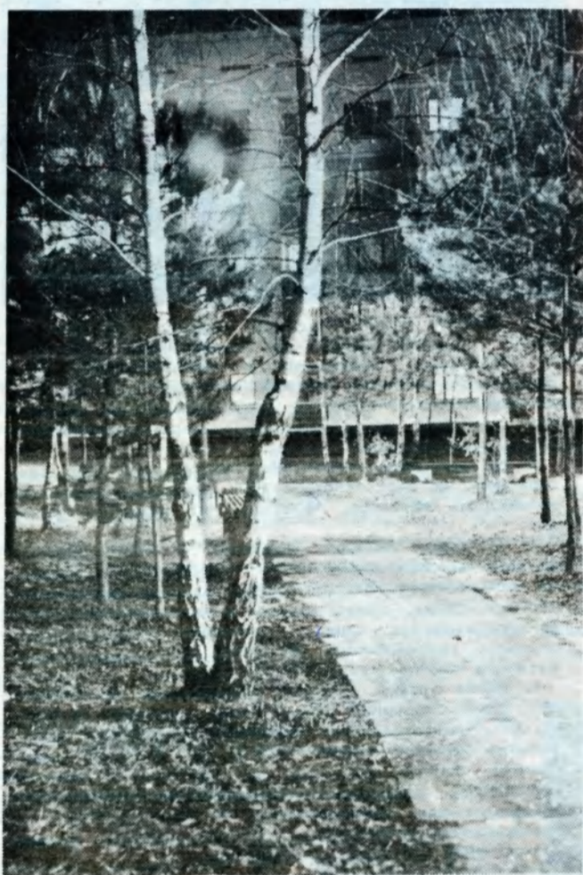
ЗДЕСЬ МЫ ЖИВЕМ...