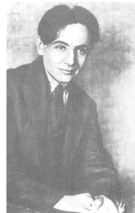
Леся Курбас. 1928 р.

влітку 1917 року. Молодий театр – це театр пошуків нових форм втілення сучасної та класичної драматургії. З цього театру взяли початок кілька українських театрів.