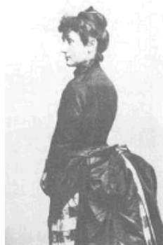
Ванда Адольфівна Курбас

Леся Курбас (Олександр-Зенон Степанович) народився 25 лютого 1887 року в місті Самбір (тепер Львівської області) у родині акторів галицького театру Степана та Ванди Курбасів (за сценою Яновичі). Батько його, хоча й був мандрівним українським актором, проте і в бідності своїй прагнув дати Олександрові гарну освіту.