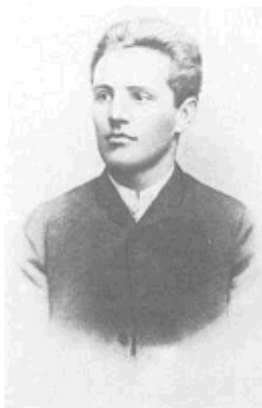
Степан Пилипович Курбас

25 лютого 2007 року виповнюється 120 років з дня народження видатного театрального діяча, ідейного провідника новаторського театру «Березиль», одного з найяскравіших представників «українського розстріляного відродження» – Леся Курбаса.