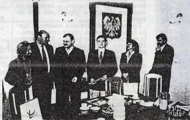
Члени делегації в мері м. Лодзі

В Польщі на сьогодні існує їх 15. Це дозволяє займатися стратегічними поточними програмами розвитку регіону, сприяти залученню і раціональному використанню внутрішніх і зовнішніх фінансових матеріальних ресурсів, ефективно здійснювати управління комунальною власністю. На протязі 10 років в Польщі проходять реформи. В порівнянні з 1993 роком в м. Лодзі в 12 раз скоротилося безробіття. Сьогодні в місті зареєстровано 65 тис. приватних фірм.