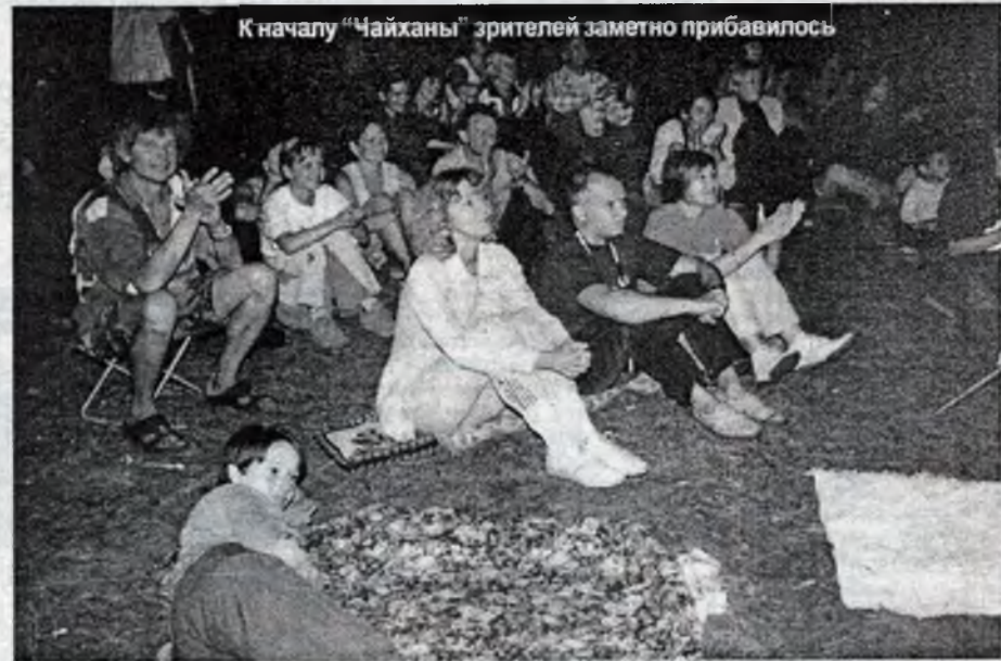
К началу "Чайханы" зрителей заметно прибавилось