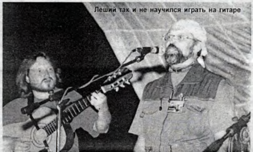
Леший так и не научился играть на гитаре