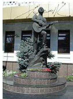
Памятник Высоцкому в Мелитополе.

Бюст Высоцкому рядом с главным корпусом АлтГПА на улице Молодежной, г. Барнаул.