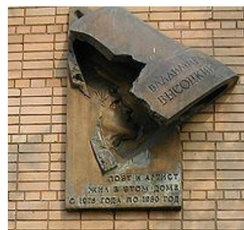
Памятная табличка на доме № 28 по Малой Грузинской улице, в котором жил Высоцкий, г. Москва.