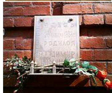
Доска на роддоме, где родился Высоцкий. Сегодня это здание принадлежит больнице МОНИКИ, г. Москва

Очень подробная и точная информация о памятниках, памятных досках, улицах, кораблях, географических объектах собрана в статье Марка Цыбульского «Памяти Высоцкого».