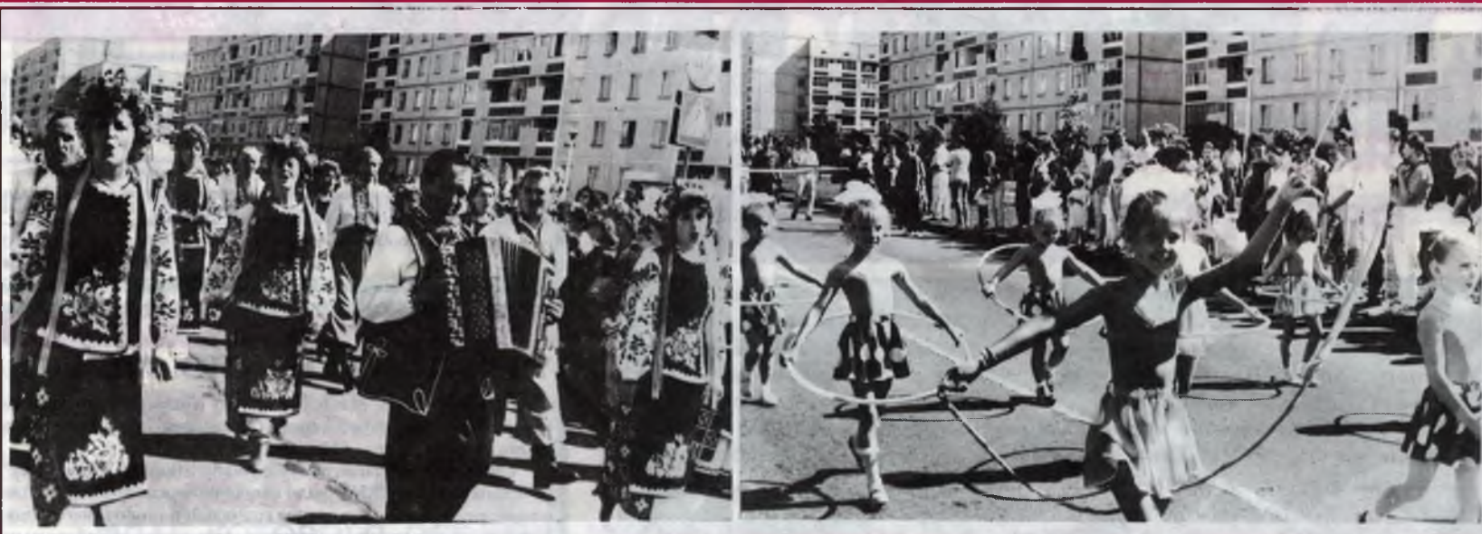
На празднике Дня Славутича.