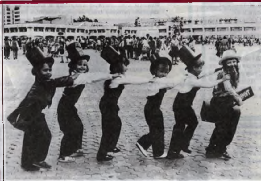
На празднике Дня Славутича.

... Был бы хороший концерт, многие не пошли пить водку.