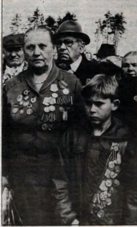
этом информирует специально заведенная картотека. Удобна во многом такая форма учета.

Наш совет стремится поддерживать со всеми ветеранами связь. Скажу без преувеличения, что мы знаем о них очень многое: год и дату рождения, домашний адрес и телефон, условия проживания, где и кем воевал, работал в послевоенные годы, какие имеет награды. Об