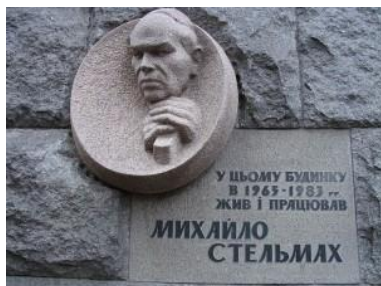
Меморіальна дошка М. Стельмаха на будинку письменників Роліт у Києві

Жив у Києві у будинку письменників Роліті по вулиці Леніна (нині Богдана Хмельницького), 68.