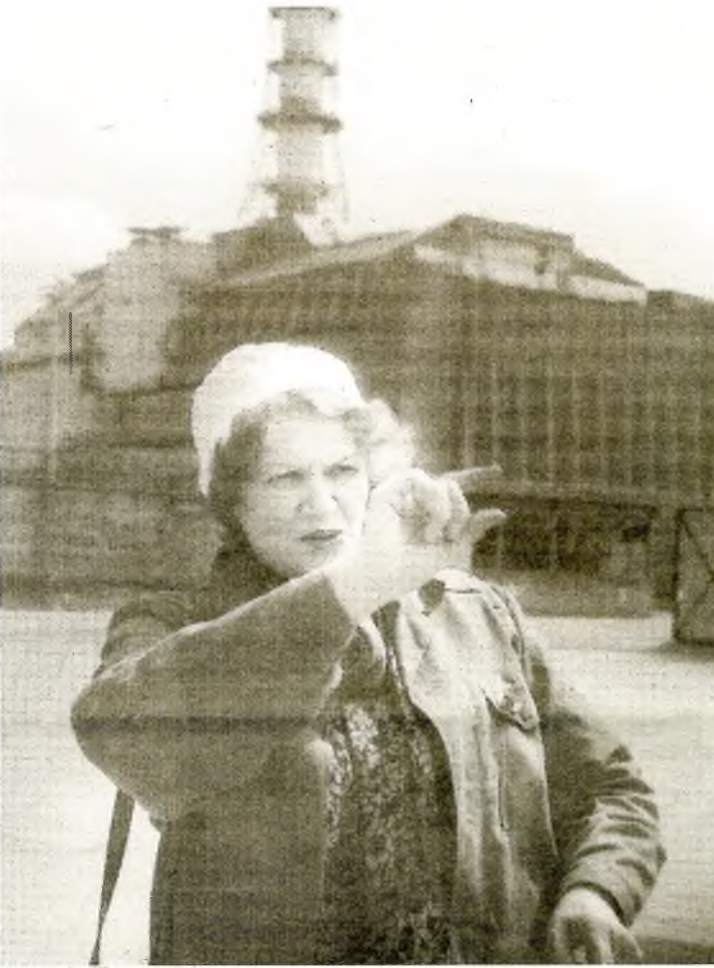
Чорнобиль — вічна тривога поетеси Ліни Костенко

тиву по технології зберігання цього ядерного палива. Зараз наша мета - в найближчі тижні відновити на майданчику СВЯП-2 роботу будівельників і монтажників.