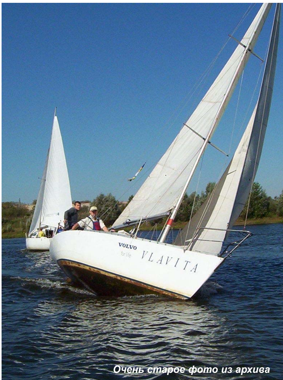
Очень старое фото из архива