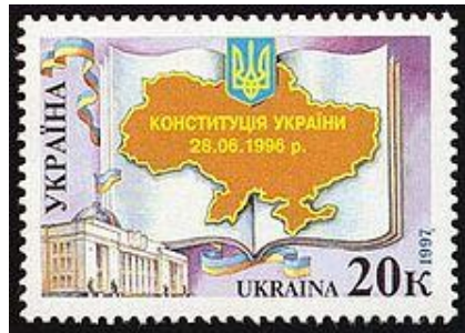
Поштова марка України, присвячена Конституції.

фактично відігравав Конституційний Договір між Верховною Радою України та Президентом України. Починаючи з 1991 р. було підготовлено цілу низку проектів нового Основного Закону. Декотрі з них досить активно обговорювалися, та з ряду причин, а головним чином через гостроту політичних процесів, лише 28 червня 1996 р. було прийнято Конституцію суверенної й незалежної України.