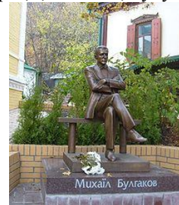
Відкритий у жовтні 2007 року пам'ятник М. Булгакову біля його будинку-музею у Києві

Письменник порушує також проблеми хабарництва, пияцтва, нечесності, неосвіченості, боягузтва, фальші почуттів та багато інших. Булгаков показав недоліки тогочасного суспільства і кожної людини, які є і зараз, і, напевне, будуть у майбутньому суспільстві.