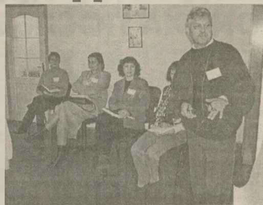
ПРОГРАММА ТРЕНИНГОВ НА НОЯБРЬ 2003 ГОДА.

Продолжительность курса — 2,5 месяца, в среднем 1 — 2 тренинга в неделю. Программа курса составлена на основании заявок, поступивших от общественных организаций, представителей органов самоуправления. Участником тренинга могут стать и жители города, которые заинтересованы в данной программе.