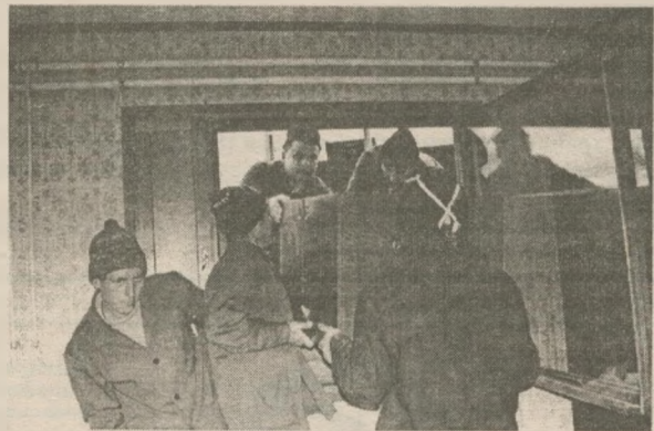
Грузчики наловчились выносить мебель через окно

своеобразном не то заседании, не то митинге прощание с Лесным вызвало чувства ностальгические: для кого-то Славутич начинался с белых пароходов, для кого-то — с Зеленого мыса, для иных — именно отсюда, с этих "мастеров", которые, по проекту, были рассчитаны на пять-восемь лет эксплуатации, а прослужили в два-три раза дольше. Может быть, можно было эксплуатировать поселок и дальше? Может, стоило бы адаптировать "мастера" под социальное жилье для злостных неплательщиков коммунальных услуг (как-то в одном из опросов, касающихся проблемы неплатежей, славутичане подозрительно дружно высказали такое предложение)? Увы! Статистика на этот счет дает ответ вполне однозначный: только ремонтные ра-