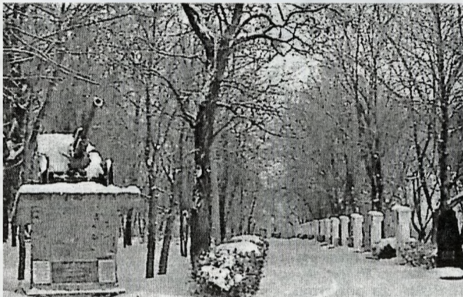
У парку Слави м.Чорнобиля