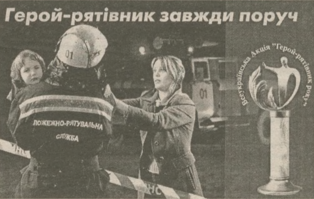
НАРОДНА СЛУЖБА ПОРЯТУНКУ "01"

На адресу поштовиків цього дня було сказано багато теплих слів та побажань. Свято закінчилось, а діалог з клієнтом продовжується.