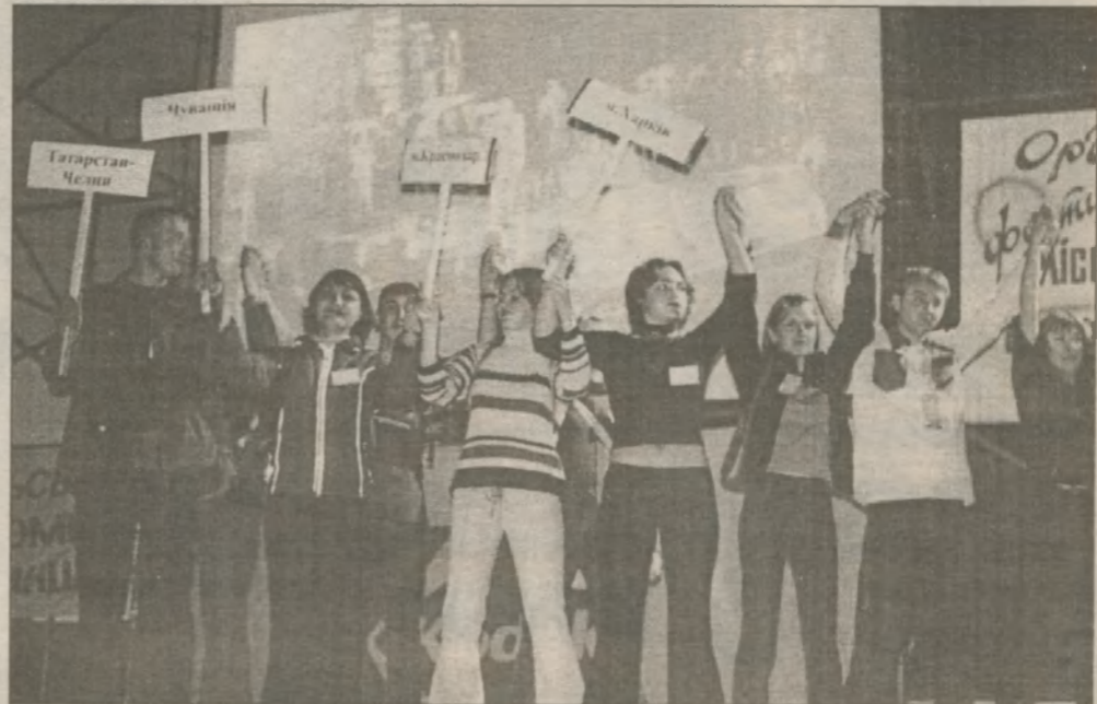
Открытие фестиваля. Впервые на сцену пригласили и журналистов-конкурсантов