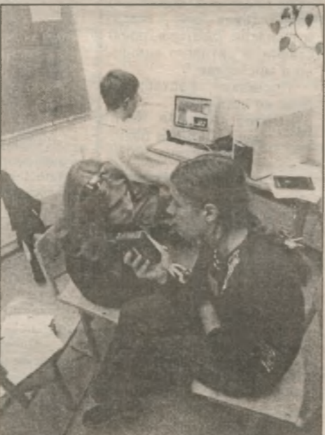
Интервью, блиц-опросы и верстка велись, как обычно, в условиях аврала