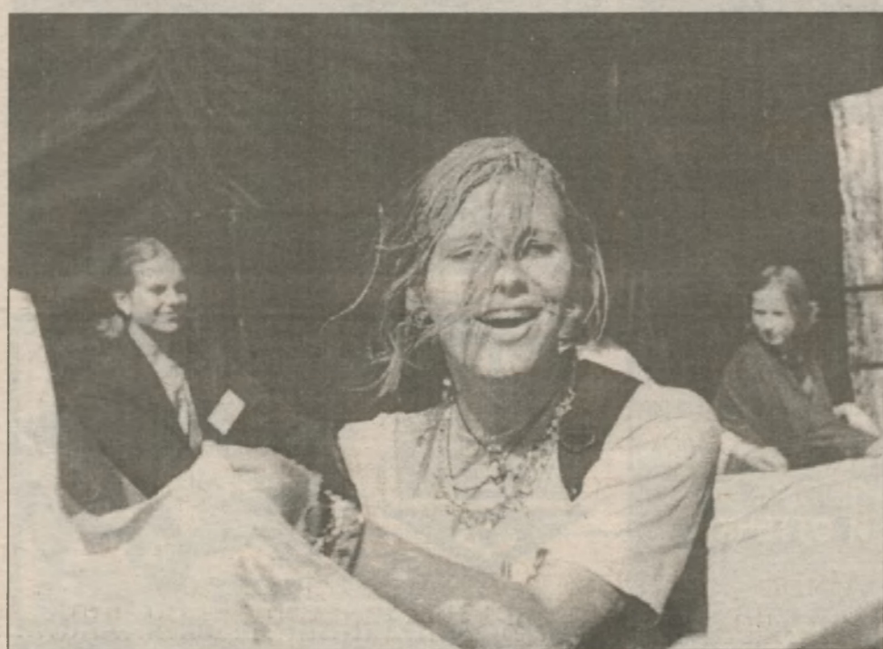
Иногда в результате братания оказываются в краске с головы до ног