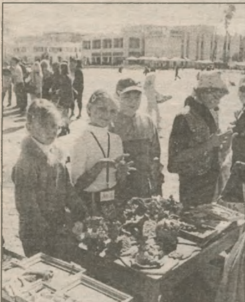
Ярмарка "Город мастеров". Мастерство демонстрировали, в основном, черниговчане