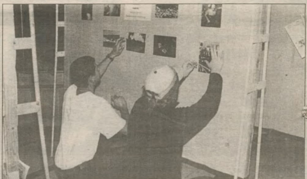
"Юн-пресс" создает фотовернисаж