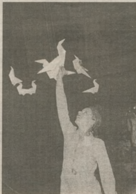
Киевский "Юн-пресс" ловит "птичку", в которой "спрятана" тема конкурсного задания