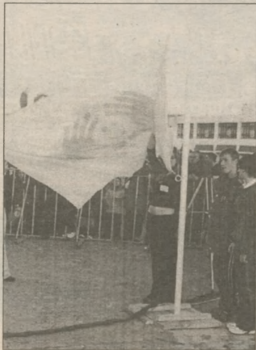
Ура! "ЗОСя-2003" открыта!