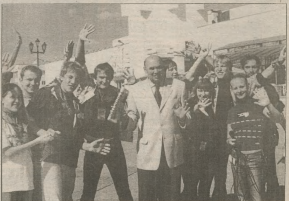
"Братальщики" порывались "побрататься" и с белым пиджаком городского головы. Но — обошлось