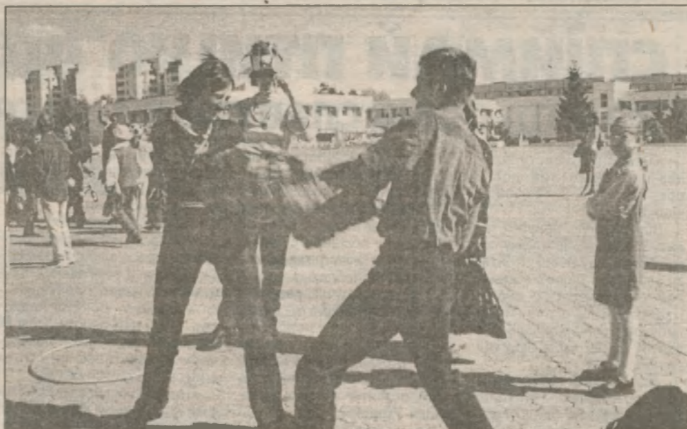
Динамика развития фестивальных знакомств и накал страстей — впечатляли