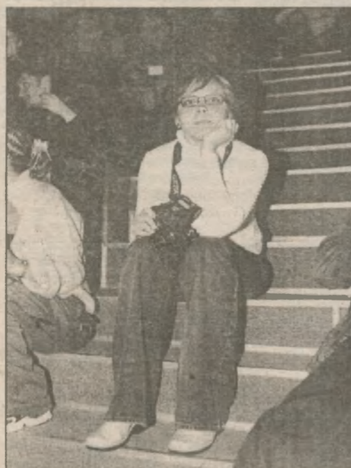
Иногда фотокоры фестиваля думали. Но — не часто. В основном, бегали и искали кадры