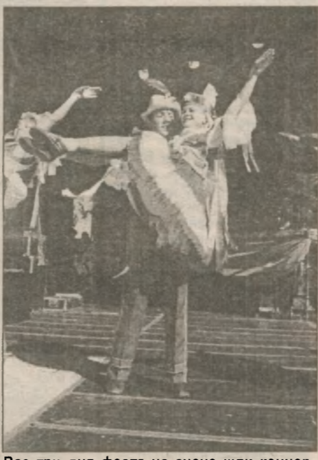
Все три дня феста на сцене шли концерты. То ли сил у творческих коллективов было много, то ли самих коллективов...