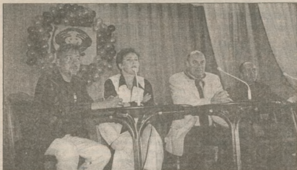
Более двух часов длилась пресс-конференция для конкурсантов. "Детишки" не церемонились и вопросы задавали жесткие. Взрослая пресса покинула зал часа через полтора