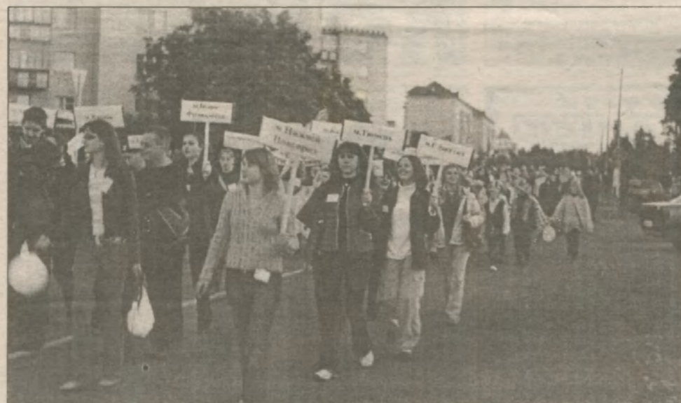
С карнавалом, задуманным для участников, как-то не сложилось: ни тебе флагов, ни национальных костюмов. А демонстрация была неплоха — человек на 500