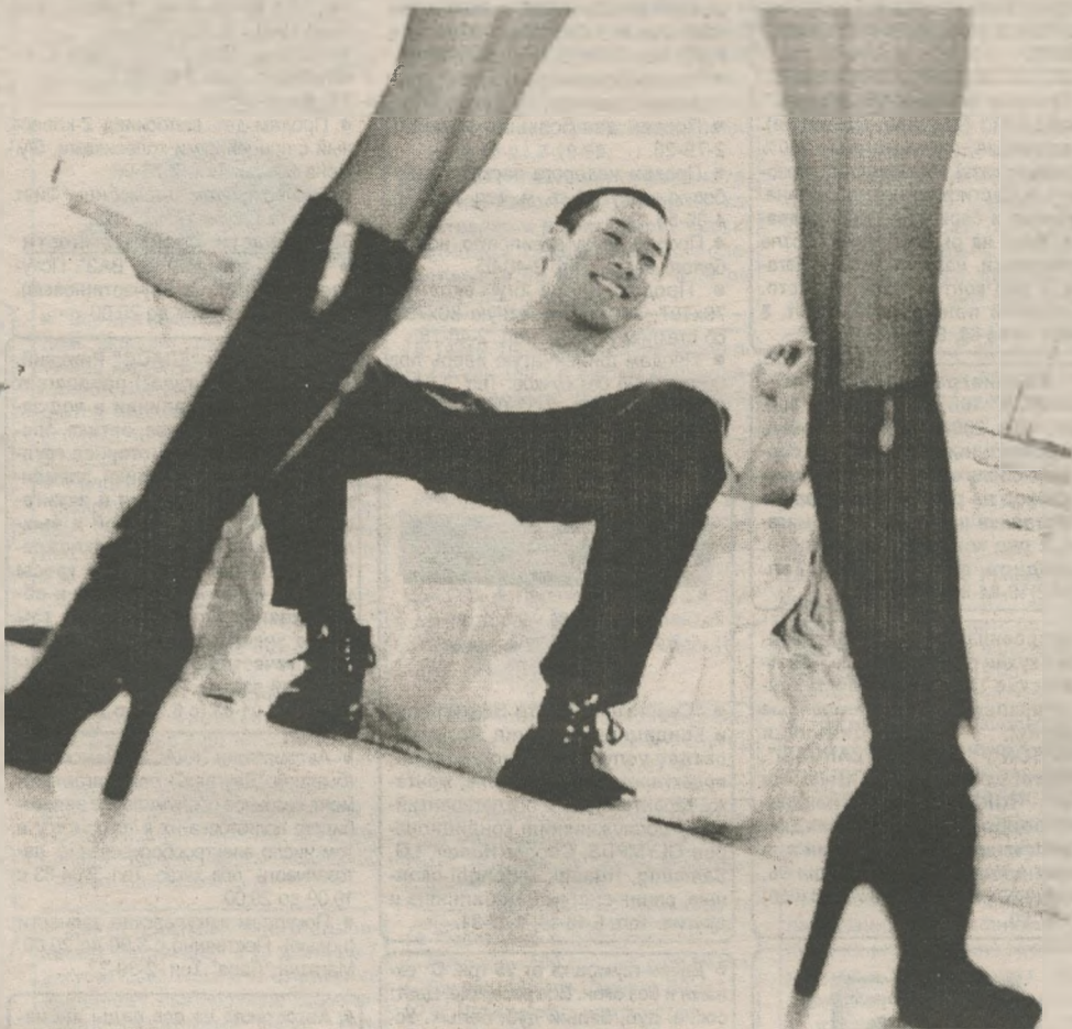
— Это захват новых рынков.

Ты собираешься на вечеринку, а подруга уже там и распространяет записки, в которых описано, как с тобой хорошо в постели.