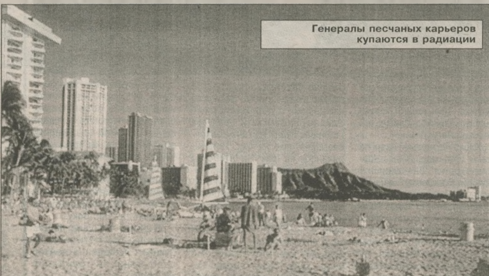
Генералы песчаных карьеров купаются в радиации