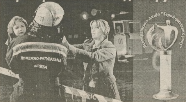
НАРОДНА СЛУЖБА ПОРЯТКУ "01"